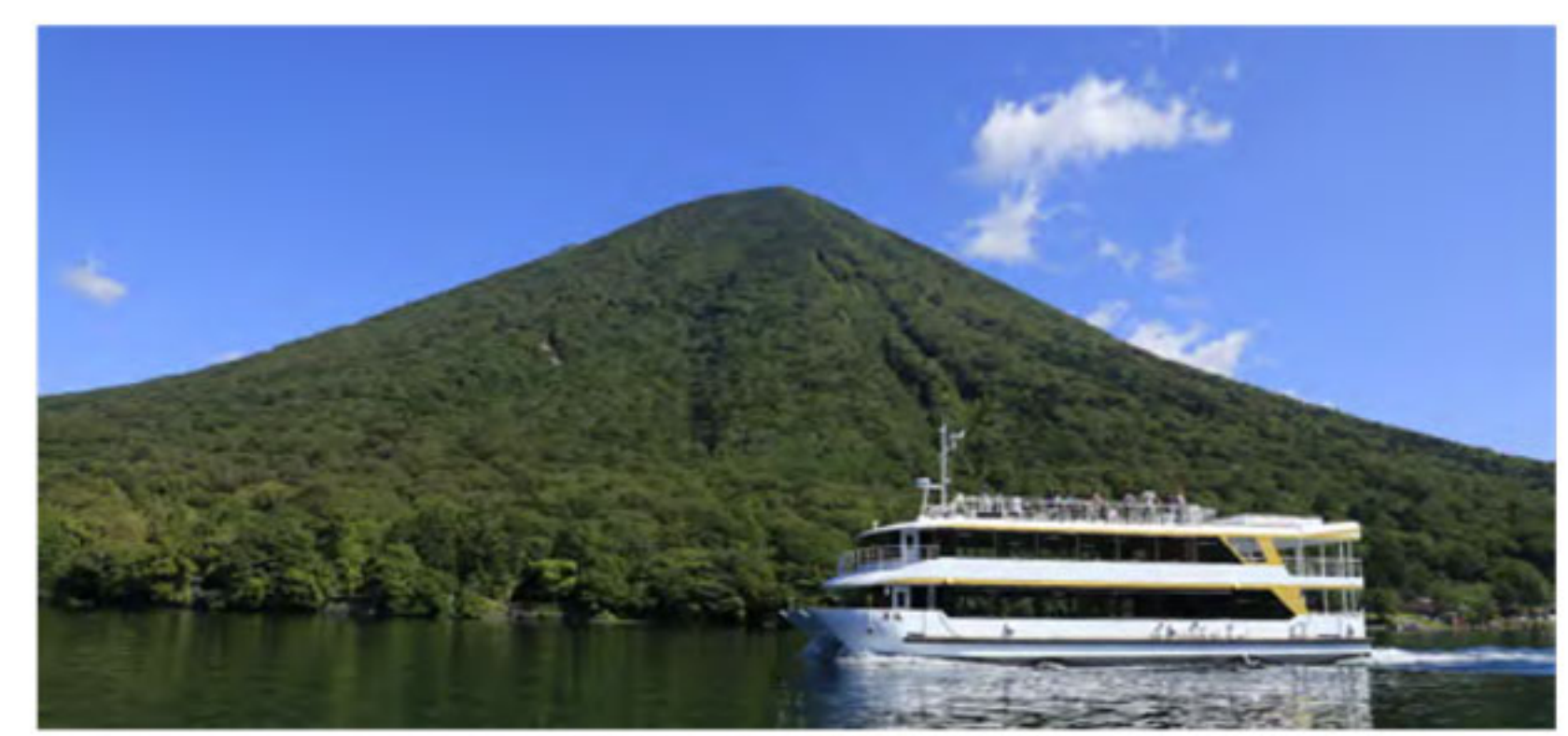
男体山と新型船「男体」