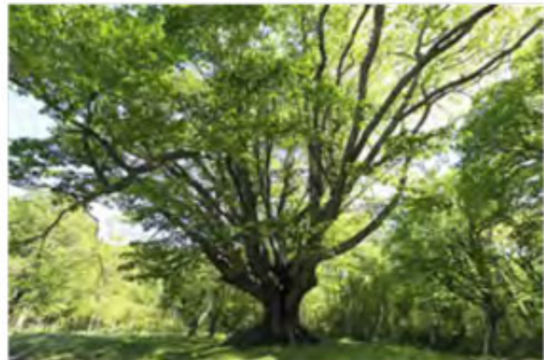
千手ヶ浜から西の湖までの原生林