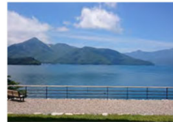
英国大使館別荘からの眺望